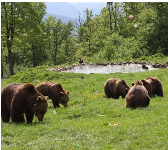
Sanctuarul de urși Liberty